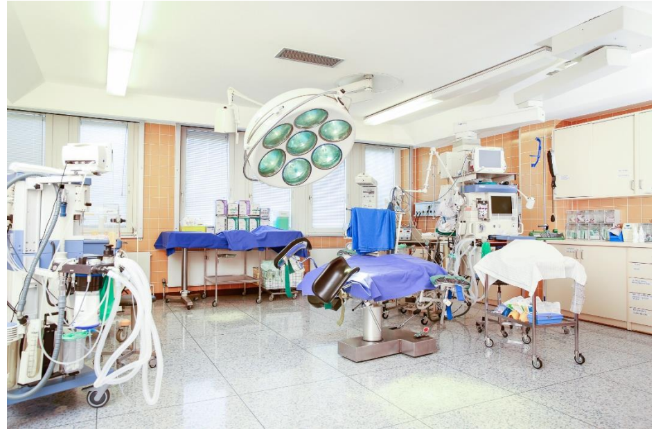
Eingriffsraum im Kreißsaal